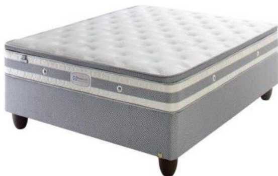
SEALY TOLEDO MEDIUM (R6 999) BEDZONE

Dit maak nie saak wat jou voorkeure is nie, die regte bed is 'n baie belangrike keuse vir jou en jou gesin.